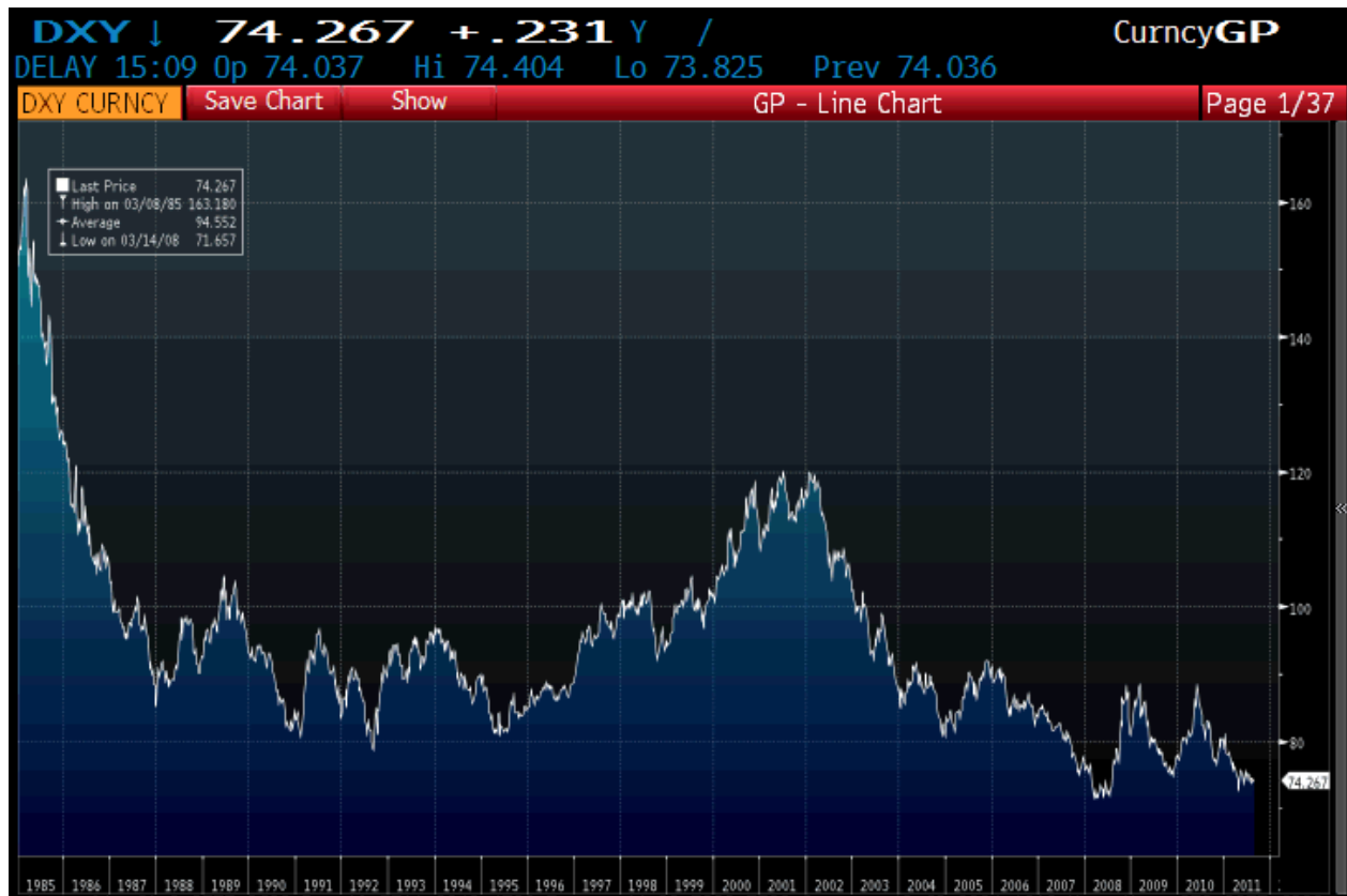
Grafico del Dollar Index desde máximos de 1985