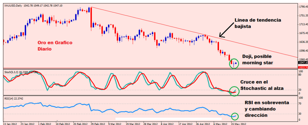
Grafico Diario en el Oro

Aunque el Oro se encuentre en una clara tendencia bajista en el grafico diario, los indicadores técnicos sugieren que existe la posibilidad de un rebote o corrección a la caída en el corto plazo. Las razones técnicas para pensar en un rebote hasta 1600-1630 son las siguientes: